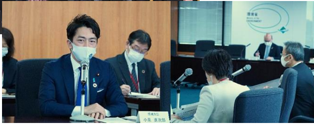
気候変動イニシアティブからの日本政府へのメッセージ